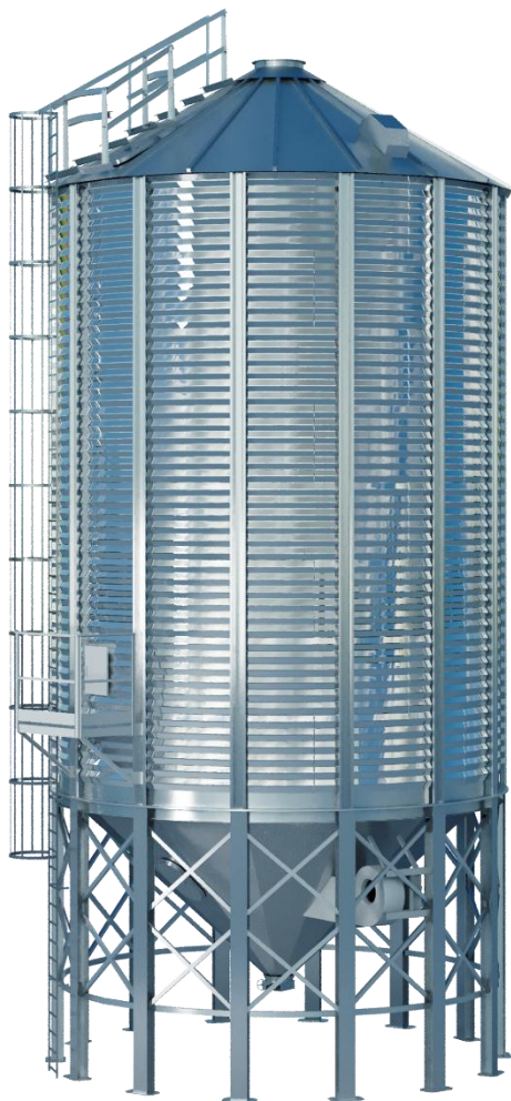
Силосы серии СК

Подходящие во всем. Клиентам ZAKROMA доступны силосы с конусным дном любого подходящего объема от 42 до 807 м 3 с углами наклона конуса 45 и 60 градусов. Параметры могут быть разными, но каждый силос создан по одинаковым стандартам. Мы проектируем, производим, устанавливаем и обслуживаем силосы собственными силами, а значит, качество производимых конструкций гарантировано.